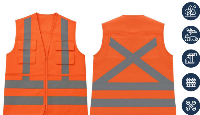
CHALECO GABARDINA 360 NARANJO ACKERLAND

CAJA MASTER: 20 UNIDADES UNIDAD DE VENTA: 5 UNIDADES POR TALLA