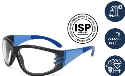
ANTEOJO DREIER PRO FOAM CLARO

CAJA MASTER: 300 UNIDADES UNIDAD DE VENTA: 12 UNIDADES