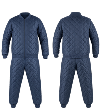
PIJAMA TÉRMICO AZUL ACKERLAND

CAJA MASTER: 24 UNIDADES UNIDAD DE VENTA: 4 UNIDADES POR TALLA