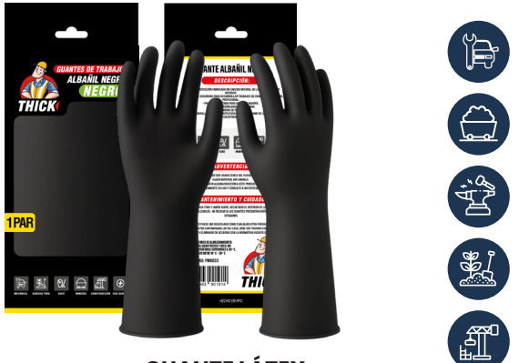
GUANTE LÁTEX ALBAÑIL THICK

CAJA MASTER: 60 PARES UNIDAD DE VENTA: 12 PARES