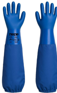
GUANTE PVC LARGO AZUL THICK

CAJA MASTER: 120 PARES UNIDAD DE VENTA: 12 PARES