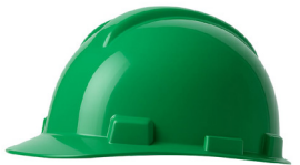
CASCO VERDE DRILO