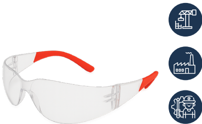
LENTE DREIER SAFETY PRO CLARO

CAJA MASTER: 300 UNIDADES UNIDAD DE VENTA: 12 UNIDADES