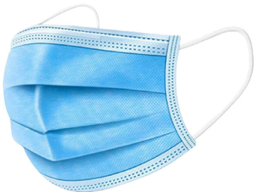
MASCARILLA 3 PLIEGUES CON ELÁSTICOS (50 UNIDADES)

CAJA MASTER: 48 UNIDADES UNIDAD DE VENTA: 6 UNIDADES