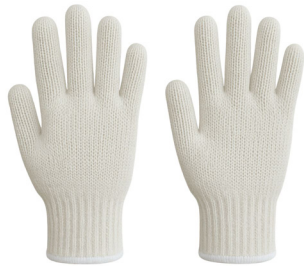
GUANTE HILO SIN PIGMENTO

CAJA MASTER: 60 PARES UNIDAD DE VENTA: 10 PARES