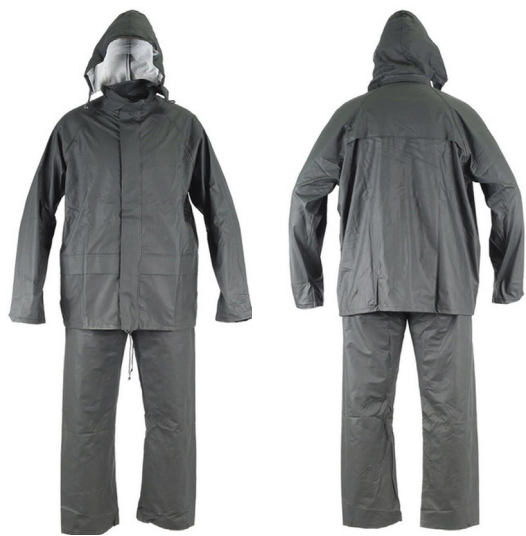
TRAJE DE AGUA PU VERDE ACKERLAND