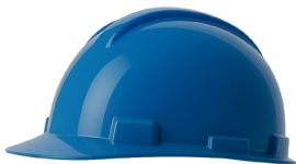
CASCO AZUL DRILO