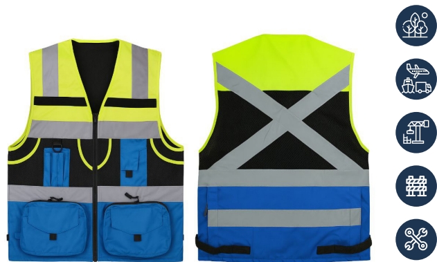
CHALECO INGENIERO AMARILLO/AZUL ACKERLAND

CAJA MASTER: 20 UNIDADES UNIDAD DE VENTA: 5 UNIDADES POR TALLA