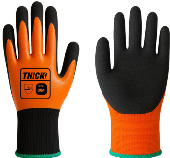
GUANTE TH-70 NITRILO FOAM THICK

CAJA MASTER: 120 PARES UNIDAD DE VENTA: 12 PARES