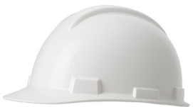
CASCO BLANCO DRILO