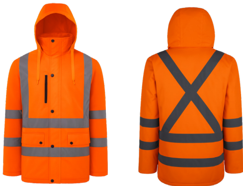
PARKA TÉRMICA NARANJA FLUOR ACKERLAND