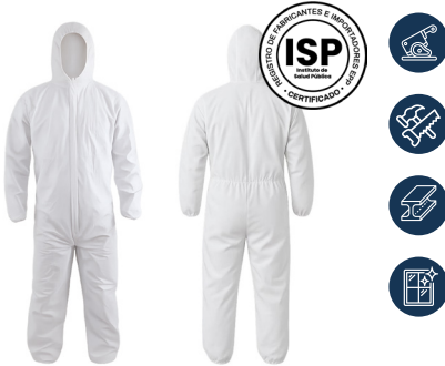
BUZO DESECHABLE BLANCO 45 GR ACKERLAND

CAJA MASTER: 50 UNIDADES UNIDAD DE VENTA: 10 UNIDADES POR TALLA