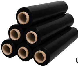
FILM NEGRO ACKERLAND

PESO NETO: 1.4 KG PESO BRUTO: 1.1 KG ESPESOR: 20 MICRAS ANCHO: 50 CM