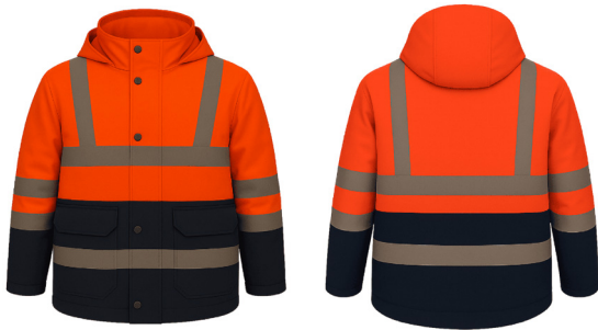
PARKA BICOLOR TÉRMICA NARANJA AZUL ACKERLAND