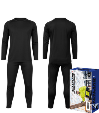
CONJUNTO PRIMERA CAPA POLIPROPILENO NEGRO ACKERLAND

CAJA MASTER: 24 UNIDADES UNIDAD DE VENTA: 4 UNIDADES POR TALLA