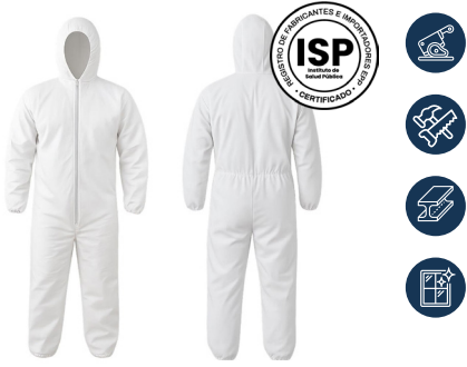
BUZO DESECHABLE BLANCO ULTRA LIGHT 35 GR ACKERLAND

CAJA MASTER: 50 UNIDADES UNIDAD DE VENTA: 10 UNIDADES POR TALLA