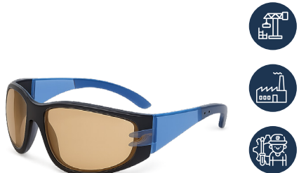
ANTEOJO DREIER PRO FOAM IN OUT

CAJA MASTER: 300 UNIDADES UNIDAD DE VENTA: 12 UNIDADES