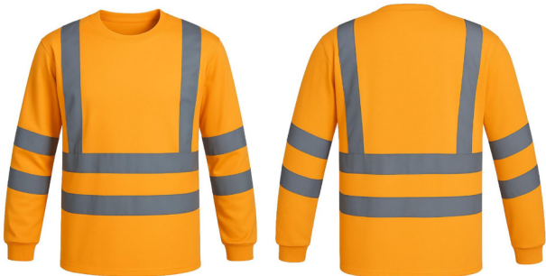
POLERA DRY FIT REFLECTANTE NARANJA ACKERLAND

CAJA MASTER: 50 UNIDADES UNIDAD DE VENTA: 5 UNIDADES POR TALLA