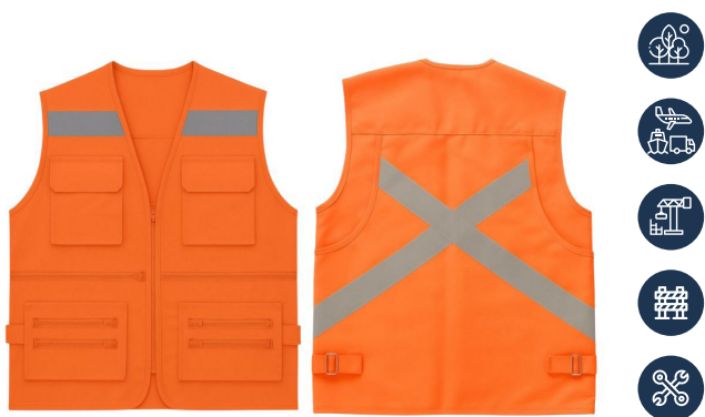
CHALECO POPLIN X ESPALDA NARANJO ACKERLAND

CAJA MASTER: 20 UNIDADES UNIDAD DE VENTA: 5 UNIDADES POR TALLA