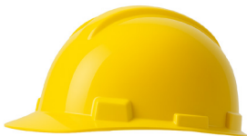
CASCO AMARILLO DRILO