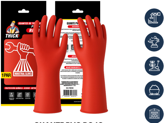
GUANTE PVC ROJO 14" THICK

CAJA MASTER: 120 PARES UNIDAD DE VENTA: 12 PARES