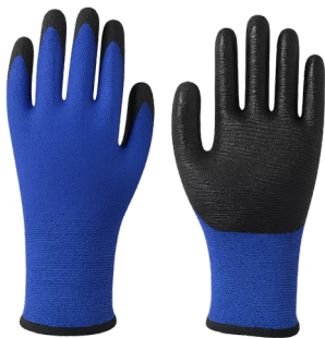
GUANTE NITRILO RUGOSO AZUL THICK

CAJA MASTER: 120 PARES UNIDAD DE VENTA: 12 PARES