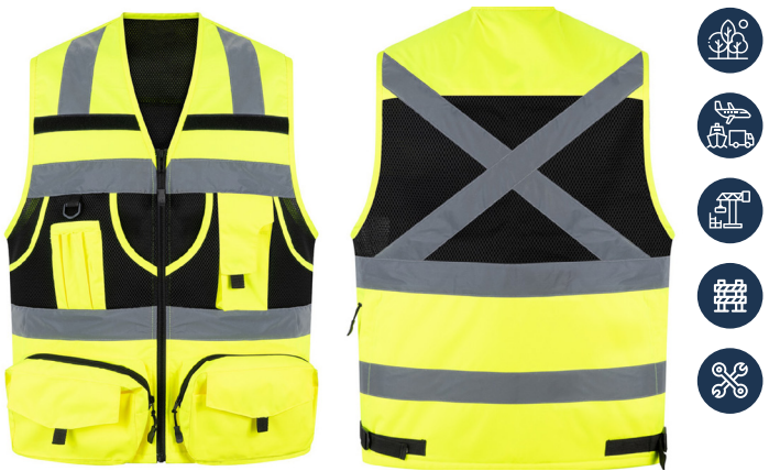
CHALECO MULTIFUNCIONAL AMARILLO 360 ACKERLAND

CAJA MASTER: 20 UNIDADES UNIDAD DE VENTA: 5 UNIDADES POR TALLA