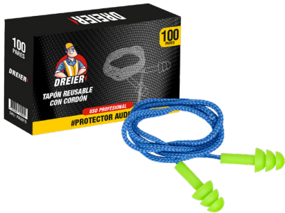
TAPÓN REUSABLE CON CORDÓN EN BOLSA

CAJA MASTER: 50 UNIDADES UNIDAD DE VENTA: 1 UNIDAD