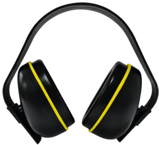
FONO DREIER TIPO CINTILLO