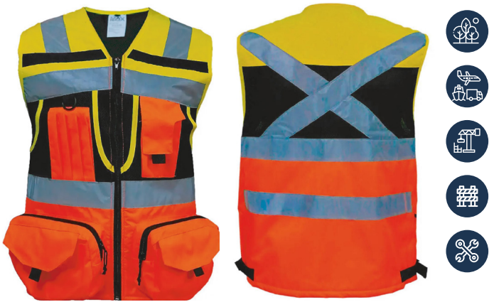
CHALECO MULTIFUNCIONAL BICOLOR 360 ACKERLAND