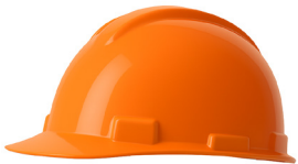
CASCO NARANJO DRILO