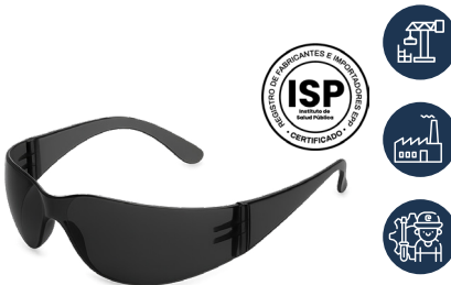
ANTEOJO DREIER SAFETY OSCURO

CAJA MASTER: 300 UNIDADES UNIDAD DE VENTA: 12 UNIDADES