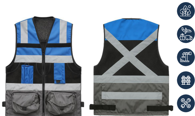
CHALECO INGENIERO AZUL/GRIS ACKERLAND