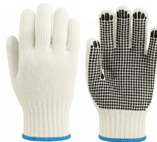
GUANTE HILO CON PIGMENTO

CAJA MASTER: 240 PARES UNIDAD DE VENTA: 12 PARES