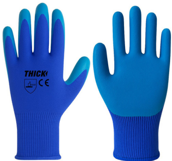
GUANTE LÁTEX TH-50 THICK