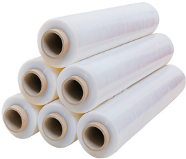
FILM TRANSPARENTE ACKERLAND

PESO NETO: 1.4 KG PESO BRUTO: 1.1 KG ESPESOR: 20 MICRAS ANCHO: 50 CM