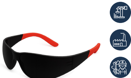
LENTE DREIER SAFETY PRO OSCURO

CAJA MASTER: 300 UNIDADES UNIDAD DE VENTA: 12 UNIDADES