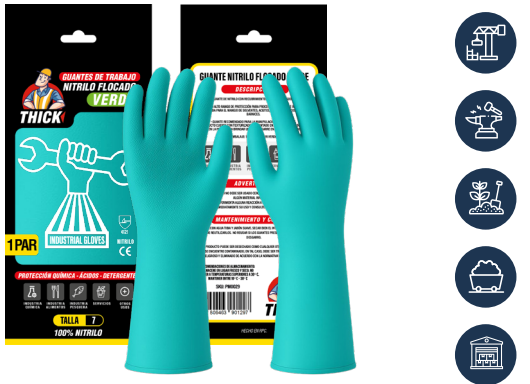
GUANTE NITRILO VERDE FLOCADO THICK

CAJA MASTER: 120 PARES UNIDAD DE VENTA: 12 PARES