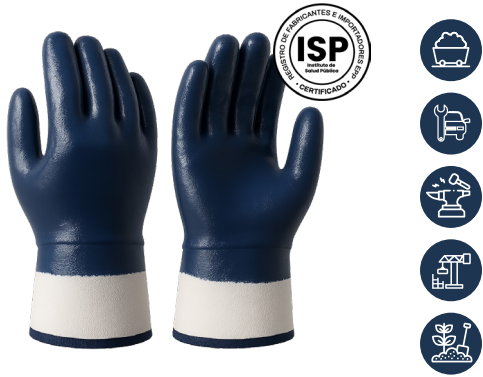
GUANTE NITRILO PUÑO SEGURIDAD AZUL THICK