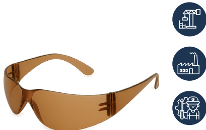
ANTEOJO DREIER SAFETY IN-OUT

CAJA MASTER: 300 UNIDADES UNIDAD DE VENTA: 12 UNIDADES