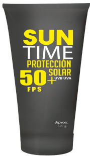
PROTECTOR SOLAR SUNTIME® FPS 50+ 120 G

CAJA MASTER: 24 UNIDADES UNIDAD DE VENTA: 6 UNIDADES