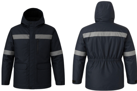
PARKA TÉRMICA AZUL ACKERLAND