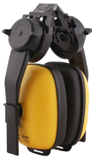
FONO DREIER PARA CASCO

CAJA MASTER: 40 UNIDADES UNIDAD DE VENTA: 1 UNIDAD