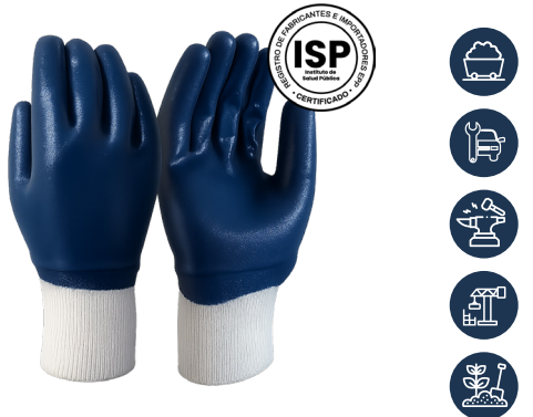
GUANTE NITRILO PUÑO TEJIDO AZUL THICK

CAJA MASTER: 120 PARES UNIDAD DE VENTA: 12 PARES