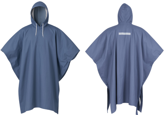
PONCHO PVC AZUL ACKERLAND