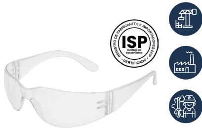
ANTEOJO DREIER SAFETY CLARO