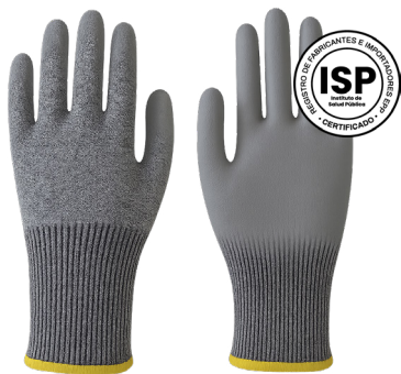
GUANTE ANTICORTE CUT 5 GRIS THICK