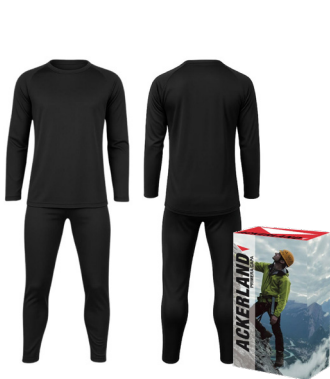
CONJUNTO PRIMERA CAPA POLIÉSTER NEGRO ACKERLAND