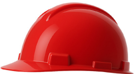
CASCO ROJO DRILO