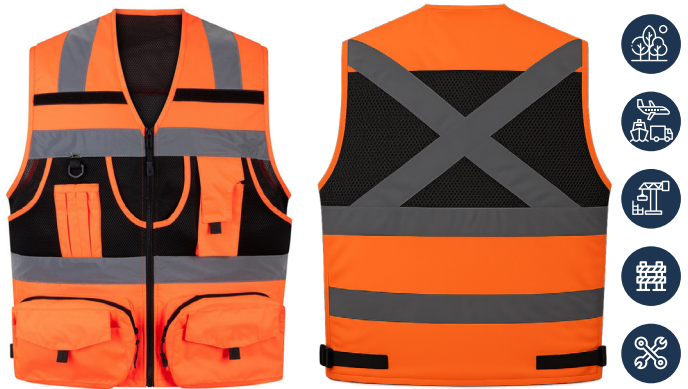
CHALECO MULTIFUNCIONAL NARANJO 360 ACKERLAND

CAJA MASTER: 20 UNIDADES UNIDAD DE VENTA: 5 UNIDADES POR TALLA