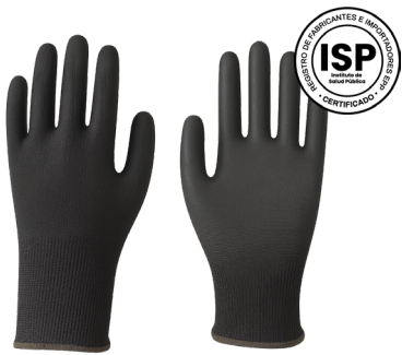
GUANTE PALMA PU NEGRO THICK

CAJA MASTER: 120 PARES UNIDAD DE VENTA: 12 PARES