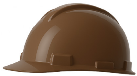
CASCO CAFÉ DRILO