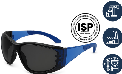
ANTEOJO DREIER PRO FOAM OSCURO

CAJA MASTER: 300 UNIDADES UNIDAD DE VENTA: 12 UNIDADES