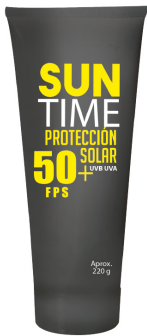
PROTECTOR SOLAR SUNTIME® FPS 50+ 200 G

CAJA MASTER: 10 UNIDADES UNIDAD DE VENTA: 1 UNIDAD