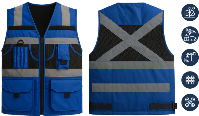
CHALECO INGENIERO AZUL ACKERLAND

CAJA MASTER: 20 UNIDADES UNIDAD DE VENTA: 5 UNIDADES POR TALLA