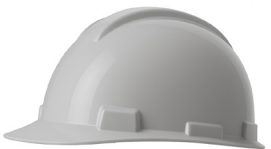
CASCO GRIS DRILO