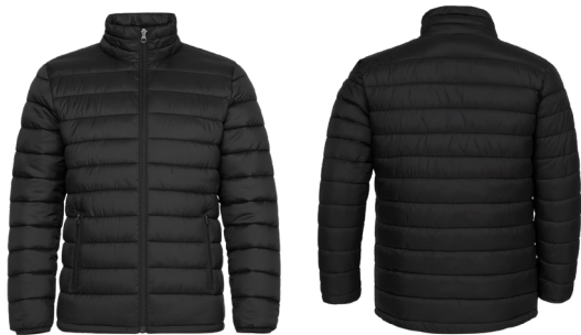
PARKA NEGRA ACKERLAND