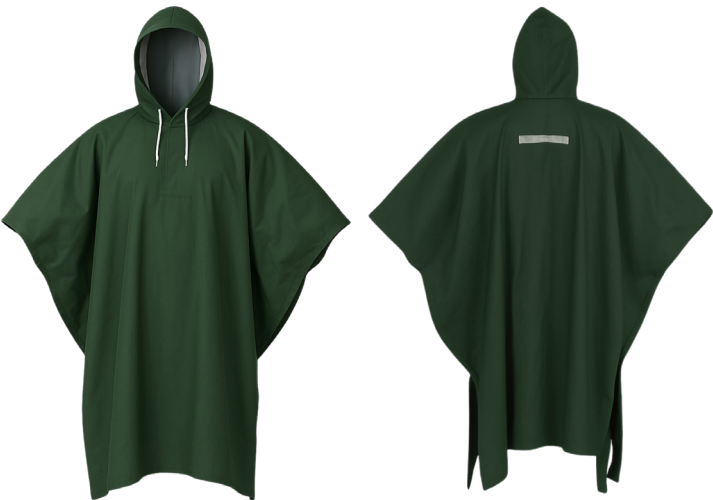
PONCHO PVC VERDE ACKERLAND