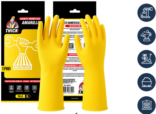
GUANTE DOMÉSTICO AMARILLO THICK

CAJA MASTER: 120 PARES UNIDAD DE VENTA: 12 PARES